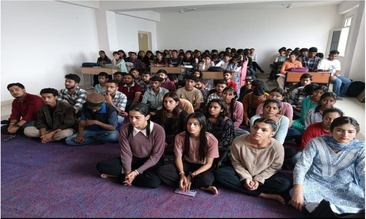
Induction Session, 2024

शिमला। जवाहर लाल नेहरू ललित कला महाविद्यालय शिमला लोहारब में नए शैक्षणिक सत्र 2024-25 के प्रथम वर्ष में प्रवेश लेने वाले विद्यार्थियों के लिए शुक्रवार को परिचय सत्र का आयोजन किया गया। इस दौरान कॉलेज स्टाफ, नए पुराने विद्यार्थियों ने कारगिल विजय दिवस के उपलक्ष्य पर देश के नाम कुर्बान हुए शहीदों को श्रद्धासुमन अर्पित किए। ब्यूरो